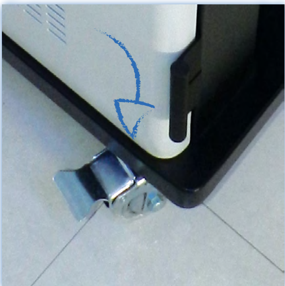
Ruedas giratorias autoblocantes