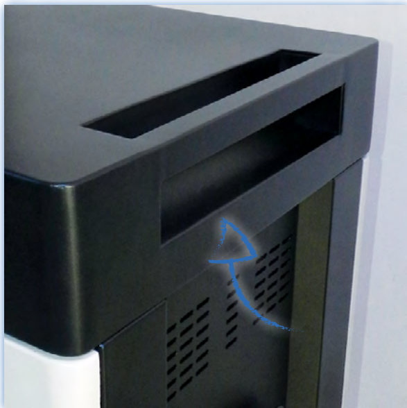
Manija empotrada sólida pero no voluminosa