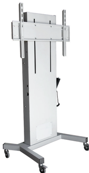
Controle Remoto com Switch de segurança.

Regulável em altura a 45 centímetros - máxima suportada em Peso 150 kg - Dimensões min (W x H x D) 100 x 107 x 68 cm - max Dimensões (W x H x D): 100 x 152 x 68 cm